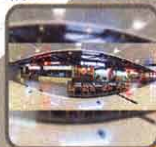
Burger King + Thai Express Stores (Yangon)