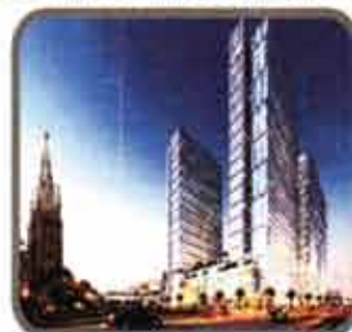
Junction City (Hotel) Project