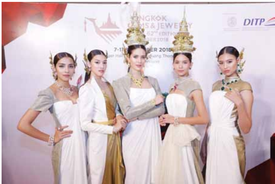
ရတနာလုပ်ငန်းက ကုန်သွယ်ရေး၊ ခရီးသွားလုပ်ငန်း၊ အလုပ်အကိုင်ရရှိမှု၊ ကုန်ပစ္စည်းနှင့် ဝန်ဆောင်မှုကို တန်ဖိုးမြှင့်ခြင်းနှင့် တီထွင်ဆန်းသစ်ခြင်းတို့ကို ဆောင်ရွက်ပေးသည့်အပြင် စီးပွားရေးဖွံ့ဖြိုးမှုအတွက် အရေးပါကြောင်း ချန်တီရာဂျီဇေဗက်ဗီဗာထရက်က ပြောသည်။

ခဲ့ပါတယ်။ ကျောက်မျက်နှာ လက်ဝတ်ရတနာလုပ်ငန်းက အနာဂတ်ကာလမှာ တစ်ဟုန်ထိုး ဖွံ့ဖြိုးလာလိမ့်မယ်လို့ အပြည်ပြည်ဆိုင်ရာ ကုန်သွယ်မှု မြှင့်တင်ရေးဌာနက ယုံကြည်ပါတယ်”ဟု ဌာန၏ ညွှန်ကြားရေးမှူးချုပ် ချန်တီရာဂျီဇေဗက်ဗီဗာထရက် ကပြောသည်။ “ဒီလုပ်ငန်းဖွံ့ဖြိုးရေးအတွက် အဓိကကျတဲ့ အကြောင်းတရားတွေထဲမှာ အမေရိကန်ပြည်ထောင်စုနဲ့ ဥရောပလို ပို့ကုန်ဈေးကွက်တွေမှာ စီးပွားရေးဖွံ့ဖြိုးတိုးတက်ရေးလည်း ပါဝင်သလို လွန်ခဲ့တဲ့နှစ်အနည်းငယ်အတွင်း အိမ်နီးချင်းနိုင်ငံတွေ တပြည်းပြည်း တိုးတက်လာတာတွေ ပါဝင်ပြီး ကျောက်မျက် လက်ဝတ်ရတနာတွေကို ဝယ်လိုအားကို ပိုမိုတိုးတက်စေခဲ့တာလည်း ပါဝင်ပါတယ်”ဟု ၎င်းကပြောသည်။ အဓိကဈေးကွက်များမှာ တရုတ်နှင့် ဟောင်ကောင်၊ အမေရိကန်ပြည်ထောင်စုဥရောပနှင့် အရှေ့အလယ်ပိုင်းဒေသတို့ဖြစ်ကြသည်။ ထိုင်းနိုင်ငံတွင် ကျောက်မျက်နှာနှင့် လက်ဝတ်