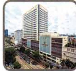
Sule Square Office Tower