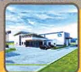
Bluescope Factory Project (Thilawa)