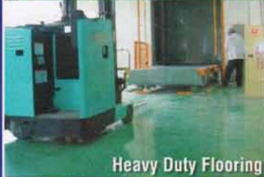
Heavy Duty Flooring