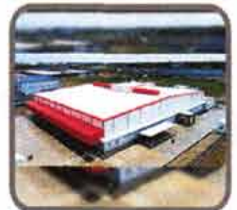
Ajinomoto Factory Project (Thilawa)