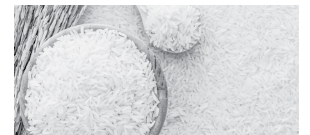
နေမည်ဖြစ်ကြောင်း လေ့လာသိရှိရပါသည်။

ယခုနှစ်အစပိုင်းတွင် ပျမ်းမျှ အမေရိကန်တစ်ဒေါ်လာလျှင် ထိုင်းဘတ်ငွေ ၃၁ ဘတ်ဖြစ်ခဲ့ပြီး လက်ရှိကုန်သွယ်မှုတွင် အမေရိကန်တစ်ဒေါ်လာလျှင် ထိုင်းဘတ် ငွေ ၃၃ ဘတ်ရှိနေပြီးထိုင်းနိုင်ငံ အနေဖြင့် ကမ္ဘာ့ဈေးကွက်တွင် ဈေးနှုန်း သတ်မှတ်ချက် ယှဉ်ပြိုင်မှုများ ပိုမိုကြုံတွေ့ နေရဆဲဖြစ်သည်ကို သိရှိရပါသည်။ ဆက်လက်၍ Thai Rice Exporters Association ၏ ၂၀၁၈ ခုနှစ်အတွင်း အင်ဒိုနီးရှားနိုင်ငံသည် ဆန်တန်ချိန် ၁ သန်းမှ ၂ သန်းအထိ ထပ်မံ ဝယ်ယူရန်ရှိပြီး ဖိလစ်ပိုင်နိုင်ငံမှ ဆန်တန်ချိန် ၅ သန်း ထပ်မံဝယ်ယူ တင်သွင်းနိုင်မည်ဟု မျှော်မှန်းထားပါကြောင်း၊ ထို့ပြင် အာဖရိက နိုင်ငံများနှင့် တရုတ်နိုင်ငံတို့မှလည်း ထိုင်းနိုင်ငံ၏ဆန်ကို အဓိက ဝယ်ယူမည်ဟု မျှော်မှန်းထားပြီး နိုင်ငံအတွင်းရှိ နယ်မြေဒေသများတွင် ရေကြီးရေလျှံမှုများ ဆက်လက်ဖြစ်ပေါ်နေမှုသည် နှစ်စဉ်ဆန် ထုတ်လုပ်မှုနှင့် ဈေးနှုန်းများ အပေါ် တိုက်ရိုက်အကျိုးသက်ရောက်မှု မရှိသေးခြင်းမှာ အဆိုပါ ရေလွှမ်းခြင်းခံရသော နယ်မြေများသည် စပါးစိုက်ပျိုးသော အဓိကနယ်မြေမဟုတ်သည့် အတွက်ဖြစ်ကြောင်း ပြောကြားခဲ့ပါသည်။ လက်ရှိ အစိုးရတွင် စားသုံးရန်မသင့်သည့် သို့လျှော့ထားသည့် ဆန်တန်ချိန် ခုနစ်သောင်းကျန်ရှိနေပြီး ၎င်းတို့ထဲမှ တိရစ္ဆာန် အစာအတွက် ဆန်တန်ချိန် နှစ်သောင်း ရောင်းချမည် ဖြစ်ပြီး စက်မှု လုပ်ငန်းသုံးအတွက် ဆန်တန်ချိန်ငါးသောင်းကျန်ရှိ