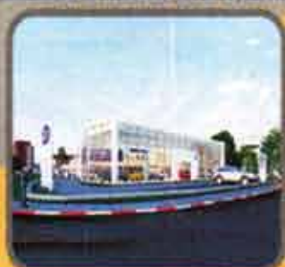
Volkswagen Show Room Project