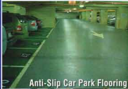
Anti-Slip Car Park Flooring

E-mail : pentensmyanmarbranch@gmail.com, Website : www.pentens.com.my