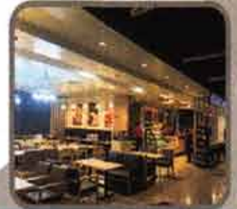
Black Canyon Stores (Yangon)