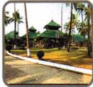
Central Hotel (Ngwe Saung) Project