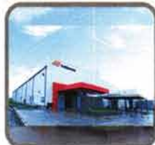
Matsunaga Factory Project (Thilawa)